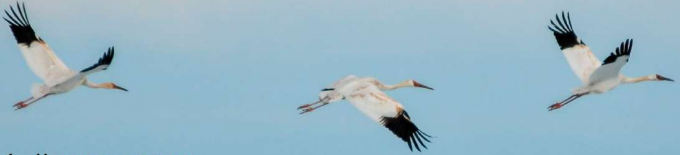
Рис.1. Молодые стерхи