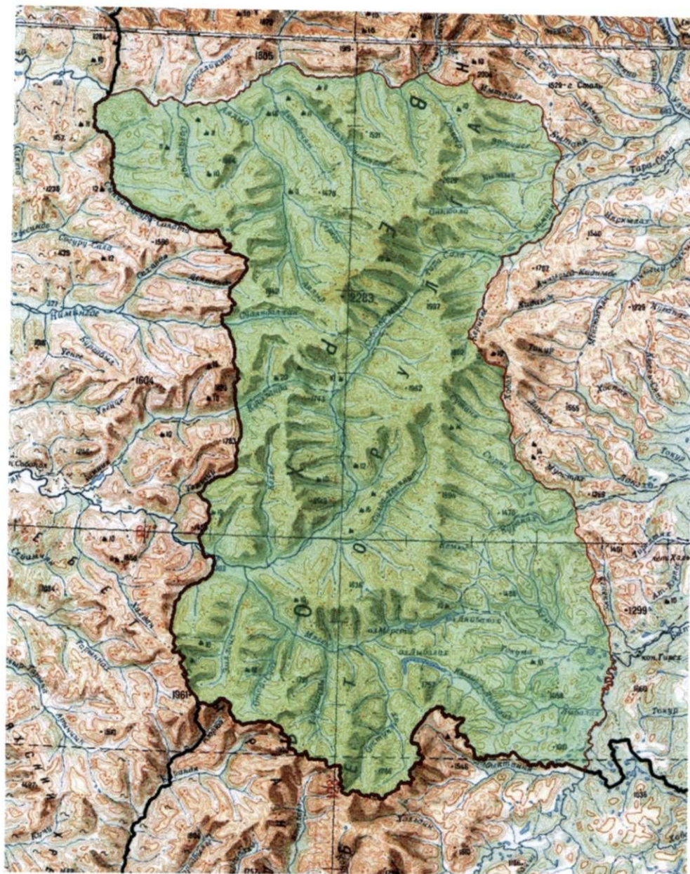
СХЕМА ГРАНИЦ РЕСУРСНОГО РЕЗЕРВАТА «ОРУЛГАН СИС» В ЭВЕНО-БЫТАНТАЙСКОМ УЛУСЕ